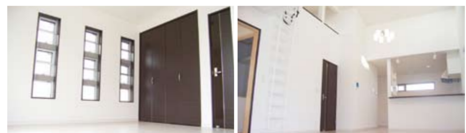
▲3連の窓がアクセントになった、明るい洋室は収納も充実 ▲高い天井に、遊び心のあるロフトもある広々とした快適なLDK (西東京市下保谷2丁目) (H 20.10分譲済)