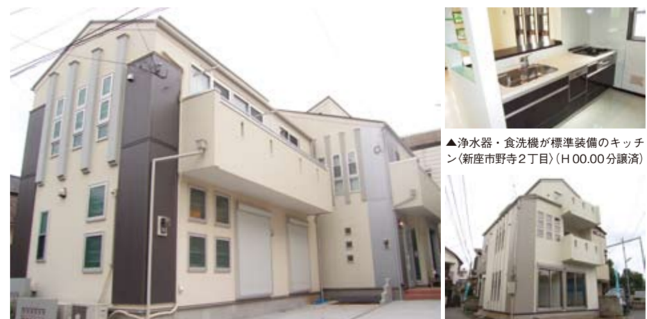
▲色や部材のバランスが美しい外観 (西東京市下保谷2丁目) (H 20.10分譲済) ▲(新座市野寺2丁目) (H 00.00分譲済)

▲ユーザーの様々な声を活かすため、営業、建築部、仕入れ部で連携体制をとり、じっくりと検討していく建築素材。快適で便利な暮らしを演出する設備機器など多岐に渡る。これらは、営業担当者が収集してきたユーザーの声を建築部と仕入れ部が検討して、家づくりに反映したものだ。この連携が住まいのいたるところ