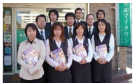
▲「ひばりヶ丘店」のスタッフたち。「豊富な情報力でお客様のお役に立ちます」(従業員一同)

マイタウンが手掛ける分譲物件の特長は、洗練されたデザイン性の高い外観や、暮らしやすさを追求し、細部にまでこだわった設計。耐久性や安全性を考慮された建