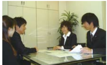
▲沿線の物件を中心に地域の豊富な情報を蓄えているマイタウンのスタッフ

また、税金や法律、金利情報などの専門知識を必要とする相談についても無料対応してくれるので、初めての家探しでも安心だ。さらに提携する多数の銀行により「自