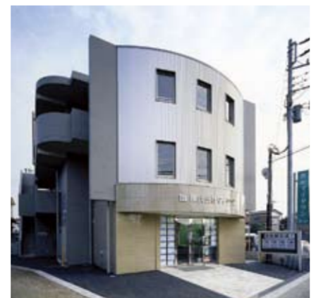
▲平成17年11月に完成した新本社外観。ゆるやかなアールを描く正面の壁が目印だ (朝霞駅徒歩4分)

物件選びには納得してもらうまで付き合い、引渡し後のアフターフォローも満足してもらえるまで真摯に取り組むという姿勢は、買主にとっては非常に頼もしい。地域密着の取り組みにより、地元での高い評価が更に信頼を生んでいるのだ。