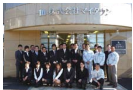
▲本社の前に集合したマイタウンのスタッフたち。「地元密着の取り組みを貫き、住まい探しの良きパートナーとして様々なご提案をしております」(従業員一同)